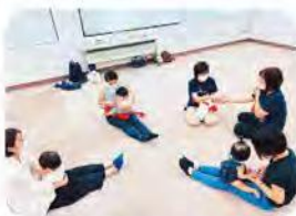
親子ふれあい遊び