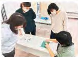
消しゴムはんこ教室

活動内容につきましては、社会福祉協議会のホームページ、チラシまたはSNSをご覧ください。