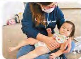
ベビーマッサージ教室