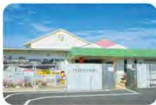
宮若さくらこども園