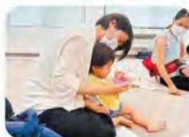
夏の果物や野菜に触れてみよう♪