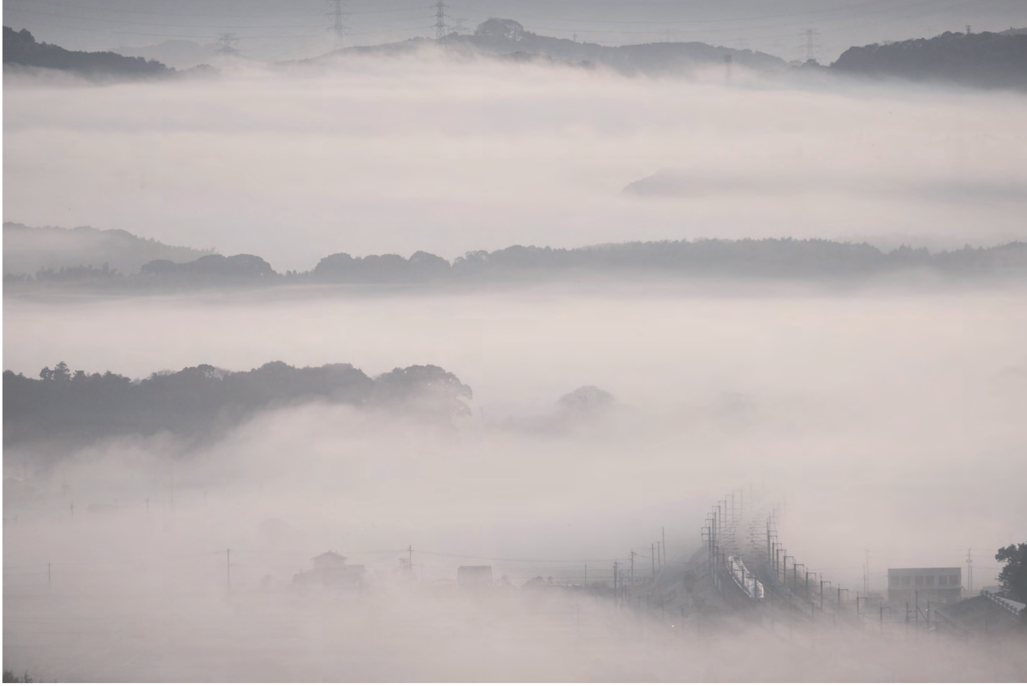
「雲海 Bullet train」