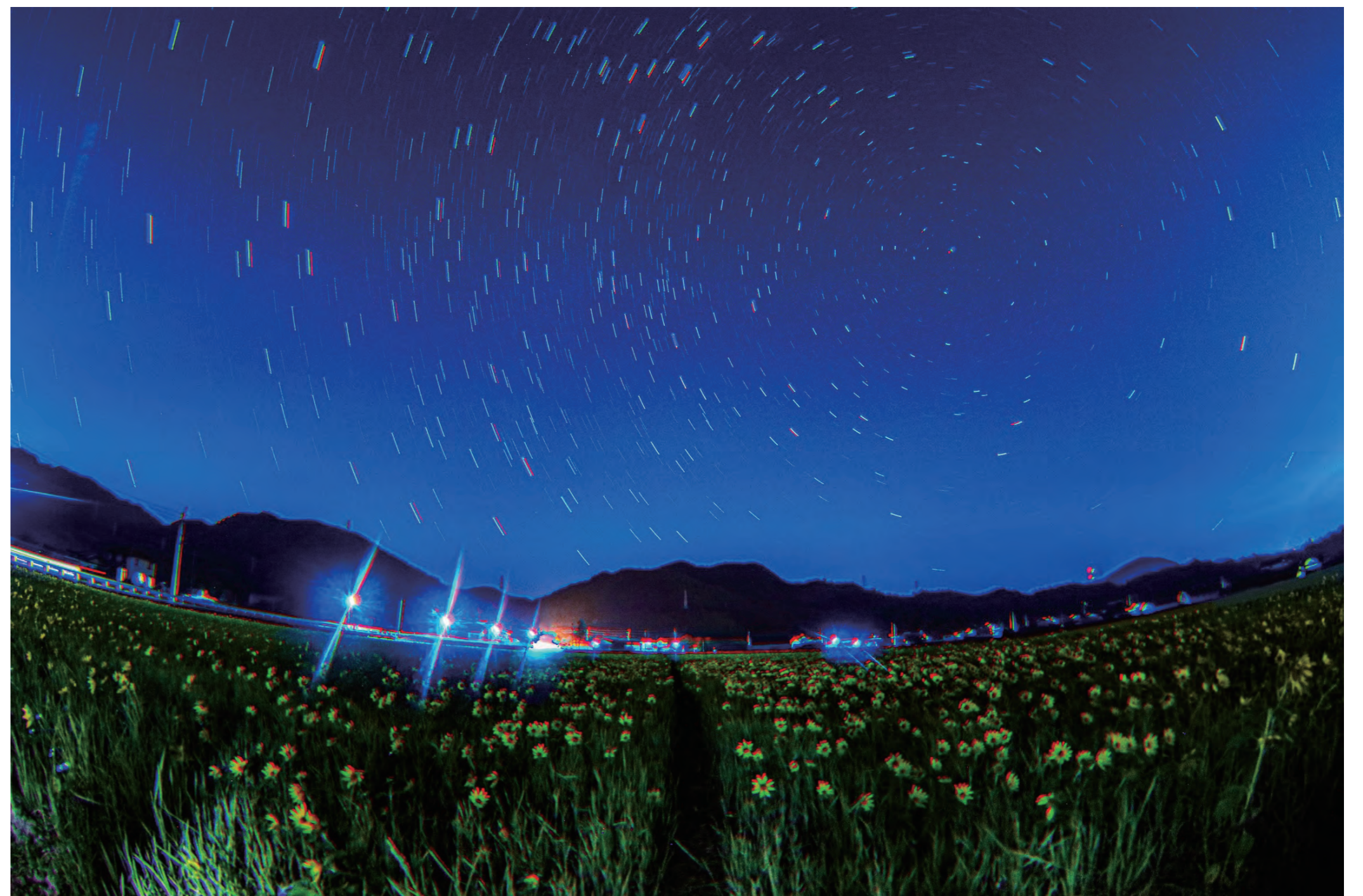
「宙（てん）と地のハーモニー」