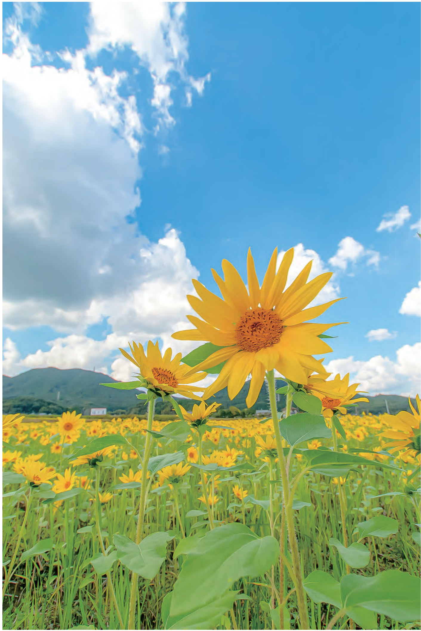
「秋空の下、元気に咲き誇る向日葵」