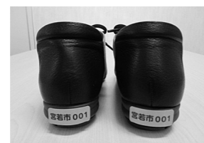
行方不明になった場合でもステッカーを目印に発見することができます

事前登録した人には履物などに貼るステッカーを交付します。顔や特徴が分かりにくくてもステッカーを目印に発見することができ ます。本人が自分の名前などを答えられなくても、登録番号を市の地域包括支援センターや直方警察署に伝えれば、本人の身元やご家族の連絡先が分かり、早期発見・保護を行うことができます。