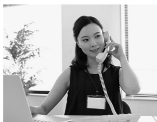
介護を必要としている市民のために働いてみませんか。

平 成30年度の地域包括支援センターで従事する雇用契約職員を募集します。募集職種は介護支援専門員で、介護予防プランの作成や総合相談などの業務です。