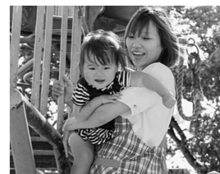
元気いっぱいの宮若っ子のために、一緒に働いてみませんか。

保 育所への入所希望増加に対して、保育士の確保が追いついていない状況が続いています。子育て家庭の支援として、保育所の待機児童をなくすために市内三カ所の民間保育園で働いてくださる保育士を募集します。