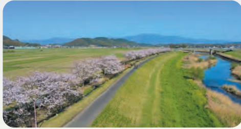
宮若市の自然いっぱい広大な空間

犬鳴川の河川敷に整備された公園。 春にはツツジや桜が、秋にはヒガンバナ が咲き誇り、四季折々の美しい姿によっ て、訪れる人々を楽しませています。