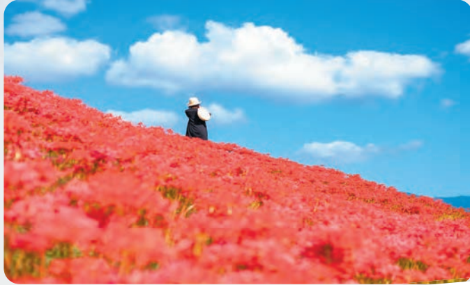
四季折々の花が見られます

春夏秋冬、様々な顔を持つ宮若市の 絶景スポットのほか、美しく整備された公園や 憩いの場なども市民に親しまれています。