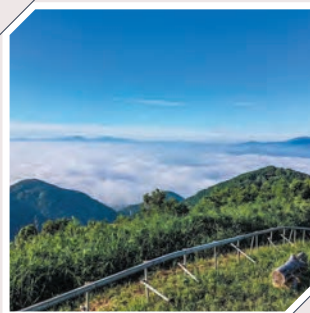
六ヶ岳山頂から望む雲海