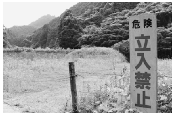
グリーン産業跡地

産業廃棄物の特定支障除去等事業については、本年度中に着手し、平成25年3月までの期間で実施される予定です。