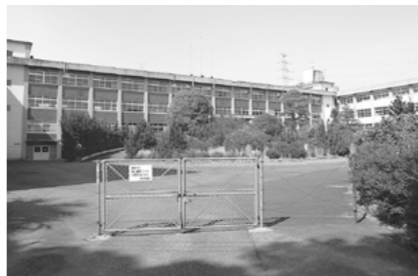
鞍手商業高校跡地

現段階においては、あくまで基本的な方針が示された状況で、細部には言及されていませんが、本市としましては、情報収集、協議を行いながら、雇用対策等に取り組んでいきたいと考えており、詳細な内容が明らかになった時点で改めてご報告申し上げたいと考えています。