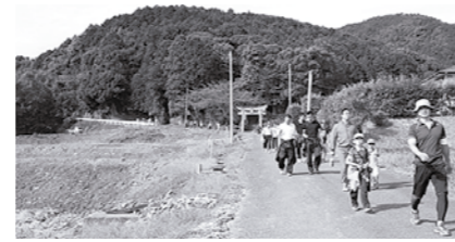
宮→西鞍の丘総合運動公園(約6キロメートル)