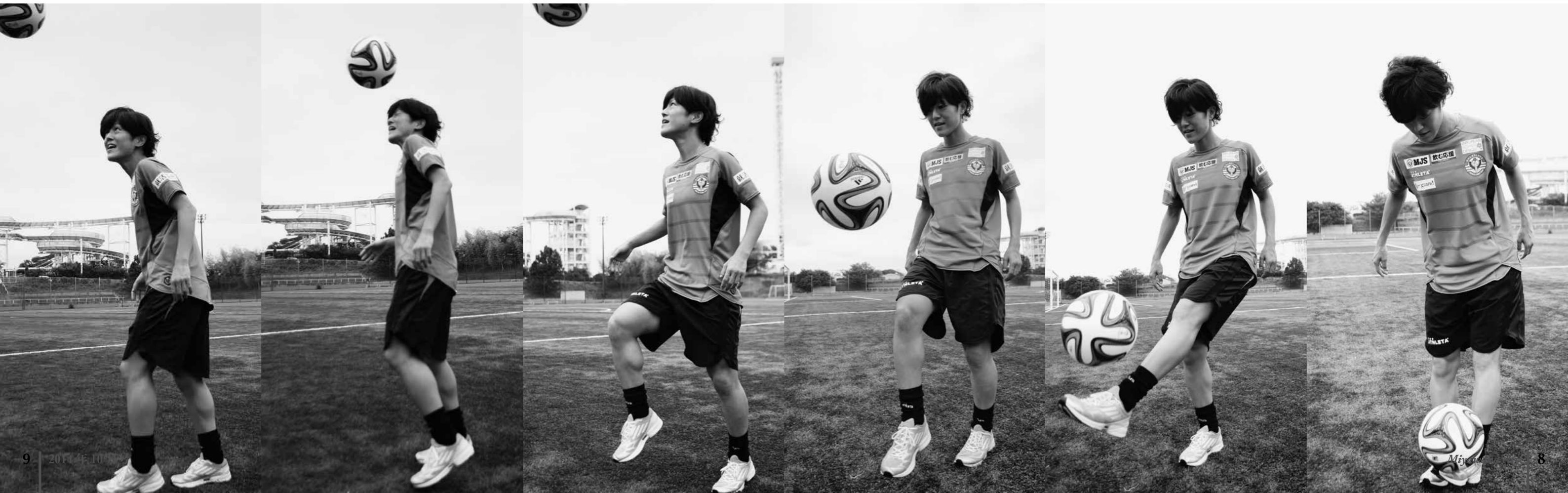
あの経験を高校で初めて受けていたなら、サッカーを諦めていたのかもしれない