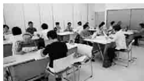
認知症サポーターには、ボランティアとして教室のサポートなどを行っていただきます。

●問い合わせ 本庁老人福祉係 ☎ 32・0515 介護保険広域連合鞍手支部 地域包括支援センター ☎ 33・3456