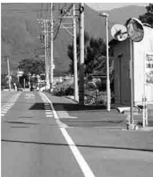
事故現場には今なお、花が手向けられています。決して戻らない命。飲酒運転撲滅へ私たちの行動が問われています。

主人が東京マラソンにこのステッカーを貼つて出場したのをニュースで知った福岡県トラック協会の人から連絡が入って、「お母さん、このステッカーをトラックに貼らせてください」って言ってくれたんです。すぐにお願ひしました。