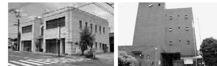
宮若商工会議所と若宮商工会が振興券の取り扱い窓口となります。

付の支払い、有価証券や商品券、ビール券、清酒券、図書券、官製はがき、印紙、切手、プリペイドカードの購入などには利用できません。 ※ ここで紹介している店舗は、10月22日現在の取扱店一覧表です。広報みやわかの発行日である11月1日以降では、ここに掲載している店舗よりも取扱店が増えている可能性があります。 店舗先にある取扱店ステッカーや宮若市公式ホームページなどでご確認をお願いします。