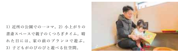
1) 近所の公園でのコマ。2) 小上がりの書斎スペースで親子のくつろぎタイム。晴れた日には、家の前のブランコで遊ぶ。3) 子どもがのびのびと遊べる住空間。