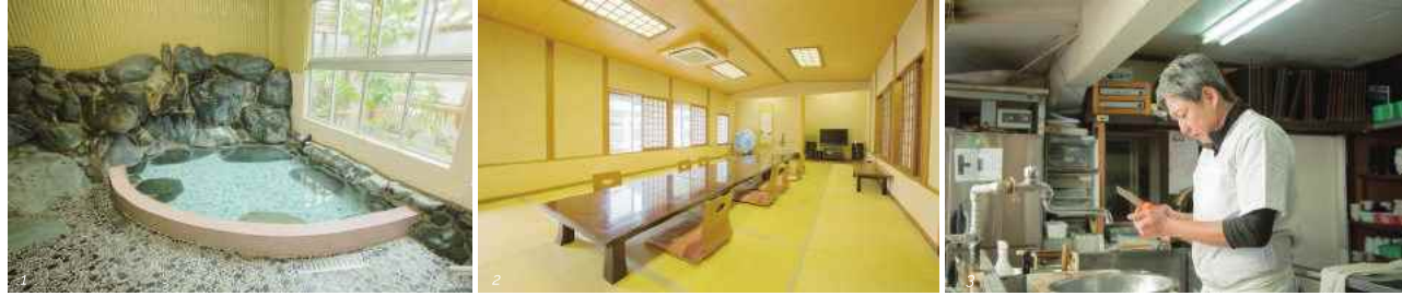
1) 写真は男湯。日帰り入浴1人500円。2) 客室は全5室。写真は、約20名収容できる一番人気の「松の部屋」。3) 調理を担当するのは弘一さん。川蟹とりんごグラタンがお薦め。