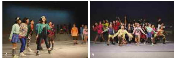
4) 5) 劇団宮若レインボーカンパニーによる市制施行10周年記念ミュージカル。会場が笑顔と感動に包まれた。