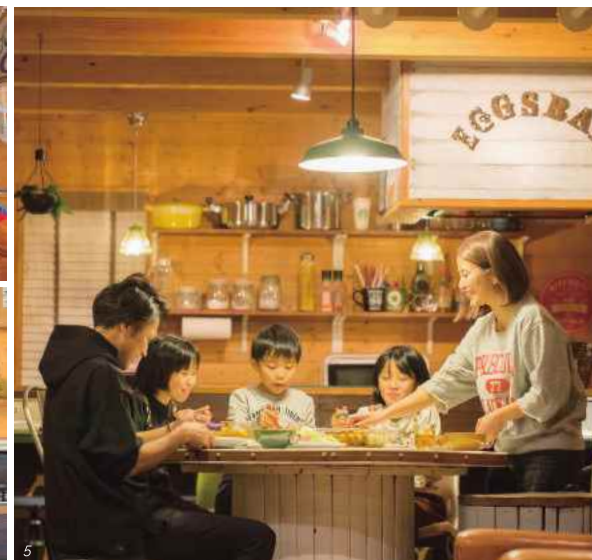
1) 職場では組み立て部門に所属 2) リビングには子ども達お気に入りのハンモックもある 3) 室内から望む美しい田園風景 4) 手づくりのバーカウンターでコーヒーを淹れて飲むことが多い 5) ほっとする家族団らの時間