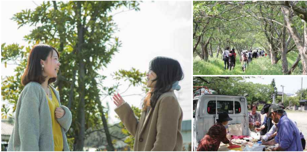
1) 地域に暮らす大人と交流を深めていくなかで、宮若市愛がどんどん募っていたという。2) 3) 宮若フットバス体験会では、まちを“歩く”ことで、新たな発見や地域の人々との交流が生まれた。お昼は軽トラカフェのおもてなしがあり、地元の食材を使用した箱ご飯などがふるまわれた。

大好きな宮若市を活性化させたいという夢のもと、北九州市立大学地域創生学群で地域づくりを学び、“楽しみながら”をモットーに地域と関わっている。小学5年生から現在まで劇団宮若レインボーカンパニーに所属し、趣味のミュージカルを楽しんでいる。好きなミュージカルは「レ・ミゼラブル」。