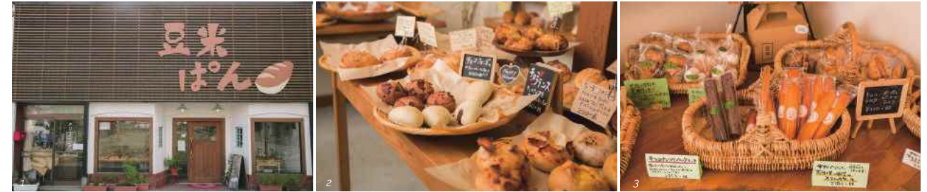
1) 福丸商店街にあるお店。大きな看板が目印。2) 焼き立てパンのいい香りに包まれる店内。お気に入りのパンを見つけてみては。3) 米粉のクッキーやシフォンケーキなど、やさしい甘さのお菓子が並ぶ

福丸商店街(追い出し猫横丁)にある米粉パン屋「豆米」。 おいしいパンの秘訣は、店主である栗原美香さんの真摯な取り組みにありました。