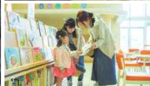
1) 絵本の読み聞かせて過ごす家族団らんの時間。2) 宮若リコリスにある子育て支援センターたんぼぼ。初対面の親子でも自然と会話が生まれる。3) 図書館で絵本探し。