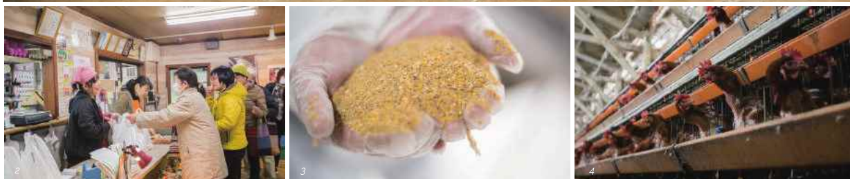
1) 長年の研究と経験から生み出された「地黄卵」。2) 2002年にオープンした直売所「たまごの里」。卵だけでなく、地元野菜や加工品なども販売しており、オープンと同時に市内外からのお客さんと賑わう。3) 遺伝子組み換えをしていないトウモロコシを使用した植物性の飼料。通常の卵よりコレステロールや脂質、カロリーが低いのもうれしい。4) 2万羽以上の鶏を管理している2階建ての鶏舎。