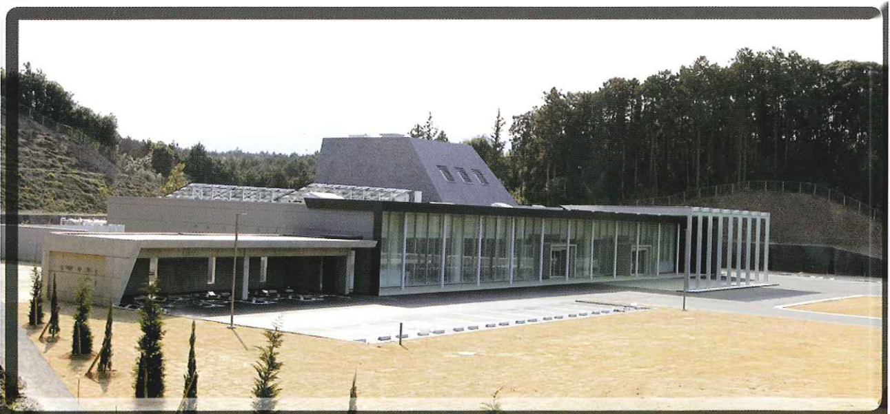
宮若市火葬場『桜華苑』全景